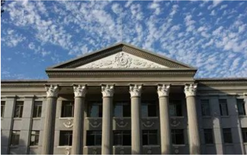
图2 广西大学大礼堂