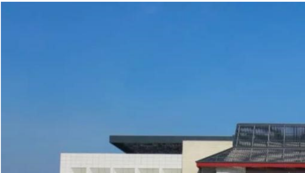
图3 广西大学汇学堂