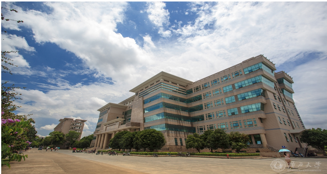
图 4 广西大学图书馆