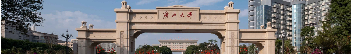
图1 广西大学正大门（南门）