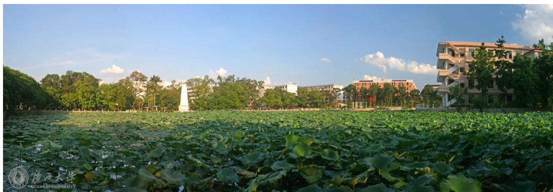
图 6 广西大学碧云湖畔